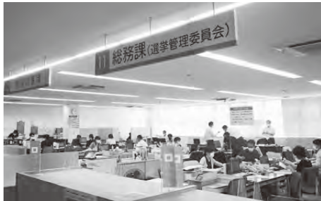
▲電子化が進む市役所