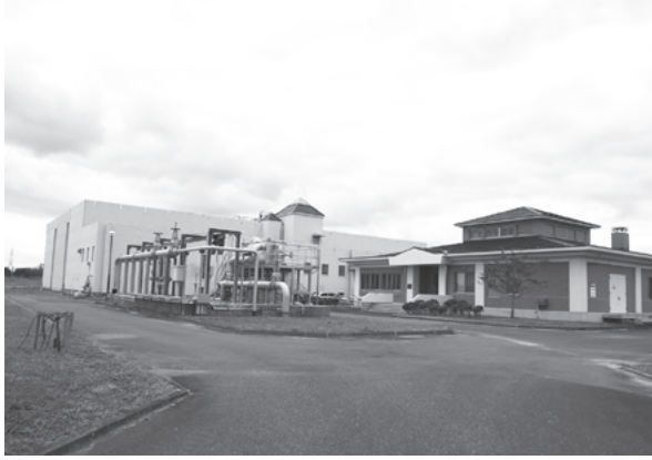
▲新たに増設をしない三日月浄化センター