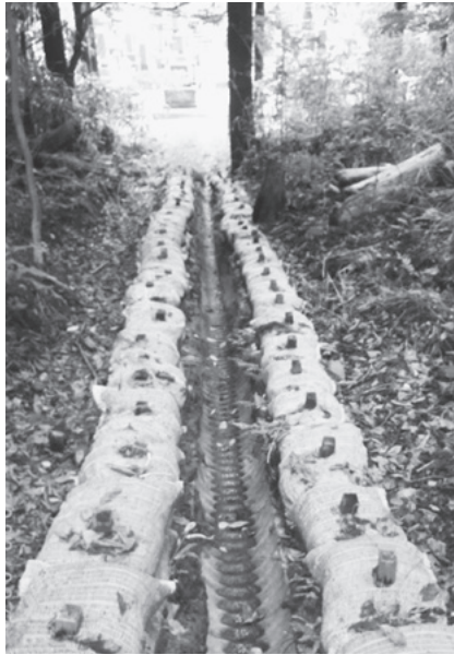
▲奥の院を囲むように設置の排水施設