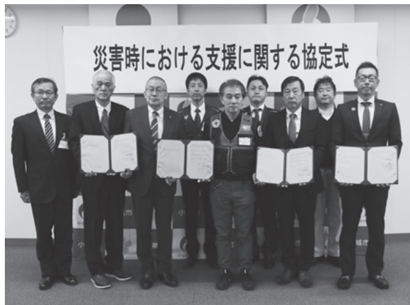
▲災害時における支援に関する協定式の様子