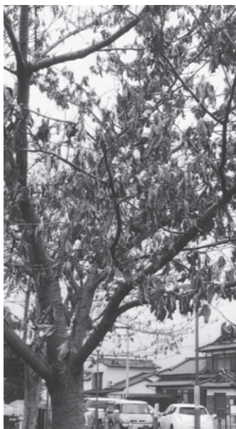
▲枯れてしまった桜の木