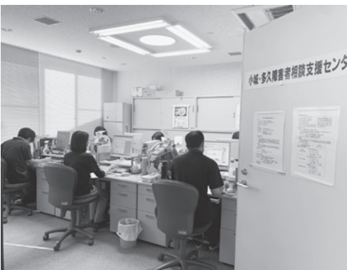
▲桜楽館の小城・多久障害者相談支援センター