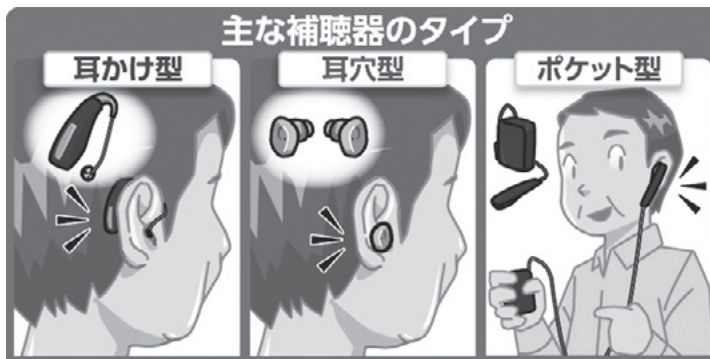
▲高齢者の「聞こえ」と生活を改善する補聴器

っているが、小城市としては加齢性難聴に対する補聴器の購入費の補助は現在、考えていない。