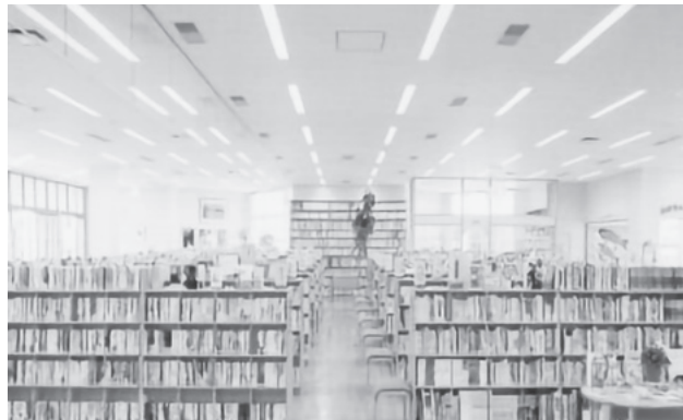
▲生涯学習の場として発展を望む市民図書館