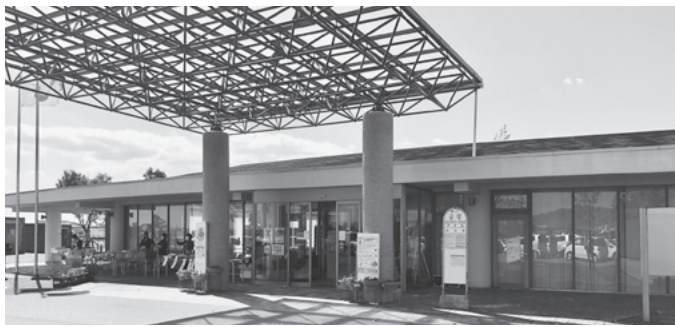
▲今後は健康スポーツセンターになるアイル