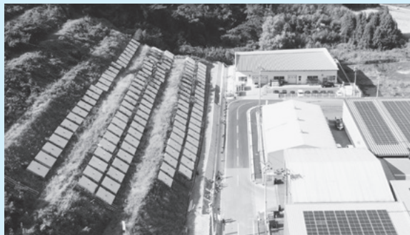
▲小城岩蔵工業団地線道路災害復旧工事現場

答弁 工期は概ね400日と見ていたが、業者 のがんばりと雨があまり多くなかった こともあり契約を短くする可能性もあ る。