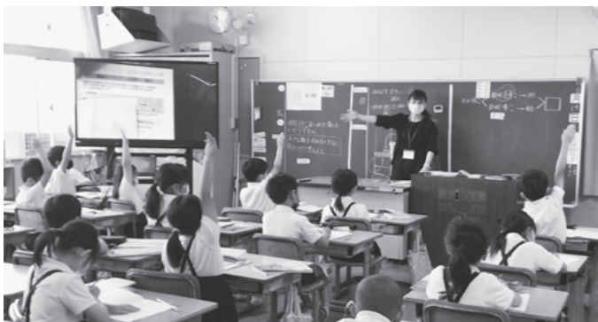
▲三日月小 授業風景