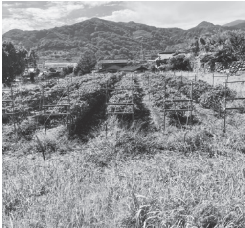
▲狭い水田で高付加価値化に取り組む農家