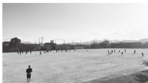
▲中学校の部活動風景

市内の中学校の部活動顧問教員の負担軽減と生徒の多様なニーズに対応した部活動指導体制の充実のため、部活動指導員(会計年度任用職員)を配置し、学校教育の充実を図る。