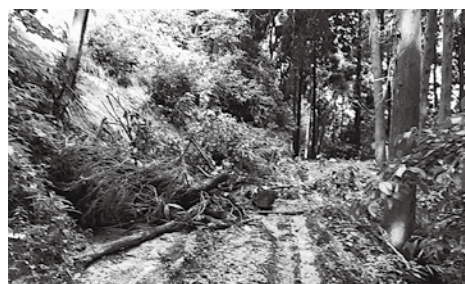
▲江里山線の路肩崩壊箇所

令和5年7月豪雨で被災した林業施設の原形復旧工事に伴う工事請負費の増額補正。 《復旧箇所》 ①天山線の法面崩壊1箇所、②江里山線の路肩崩壊2箇所、法面の崩壊1箇所