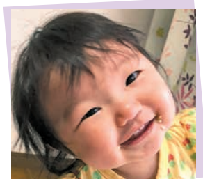
なかしま みう 中島 魅海ちゃん(牛津町)