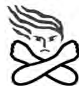
女性に対する暴力根絶のマーク

DV（ドメスティック・バイオレンス）、性犯罪、ストーカー行為、売買春、人身取引、セクシュアルハラスメントなど「女性の人権を侵害するあらゆる行為」のことです。