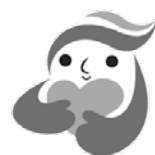
犯罪被害者等支援 シンボルマーク 「ギョっとちゃん」

この週間を通して、犯罪被害者などが置かれている状況や犯罪被害者などの名誉または平穏な生活への配慮の重要性について理解を深めましょう。