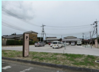
【整備された小城公園の駐車場】