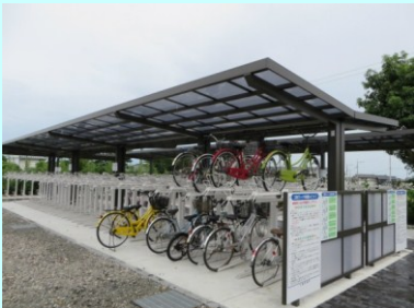
【整備された小城駅の駐輪場】