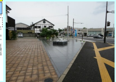
【整備されたポケットパーク】