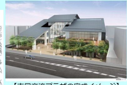
【市民交流プラザの完成イメージ】