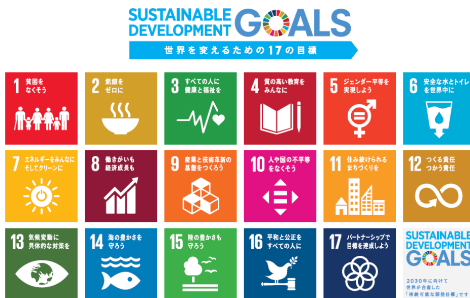
SDGs ロゴ

目標 17 持続可能な開発のための実施手段を強化し、グローバル・パートナーシップを活性化する。