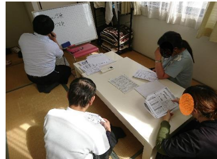
ミーティングの様子

自分に合った仕事選びや継続した就労を実現するための就労支援カリキュラムを実施しています。