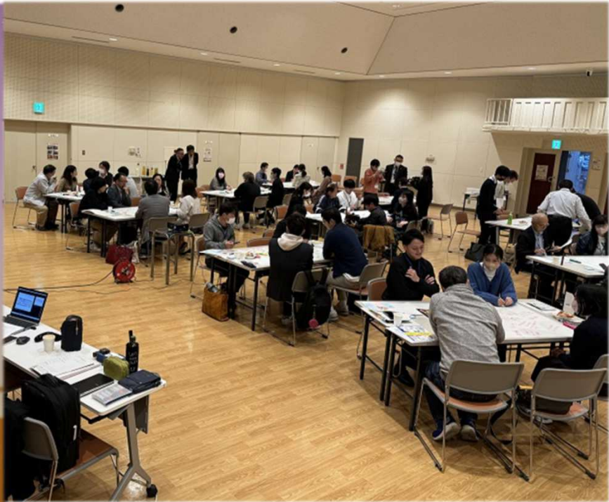
市民等参加者 45人 （うち高校生4人、大学生7人）