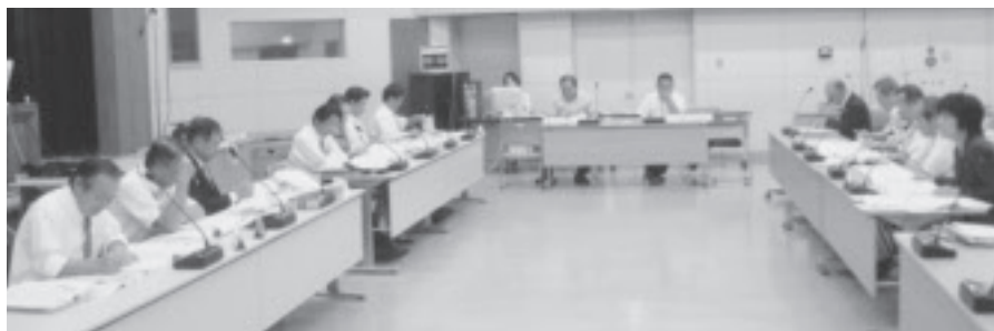
▶決算審査特別委員会