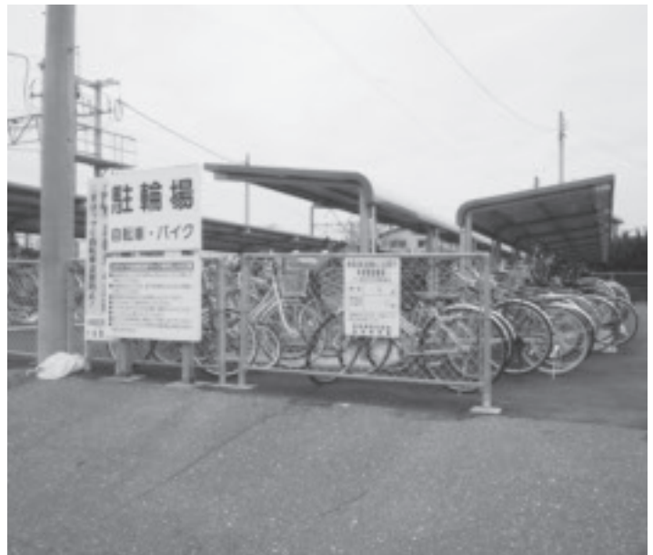
▲駅駐輪場環境改善事業