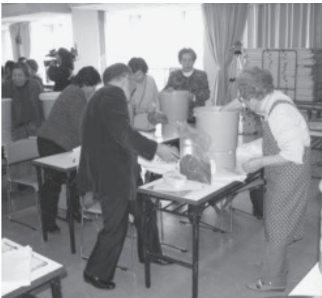
▲ごみ減量化推進事業

小城市内で一般家庭から出るごみを自ら分別・堆肥化等の処理をするために、ごみの減量化ができるダンボールコンポスト・くうたくんの普及啓発を行う。