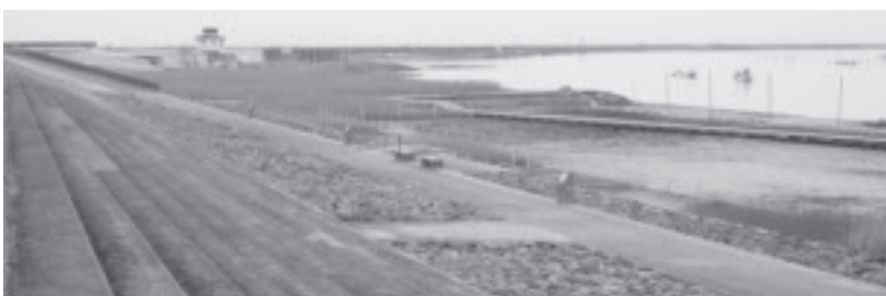
▲環境・生態系保全活動支援事業

漁協芦刈支所が主体となり、ムツゴロウ生息域である干潟の保全活動の計画づくり・環境モニタリング・清掃活動を行う。