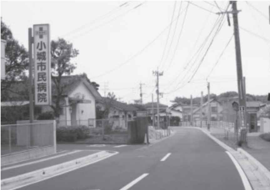
▲道整備交付金事業 (市道)

通勤・通学・通院時の 渋滞、車・歩行者の危険 を解消するため安全な道 路整備を行う。北小路― 市民病院線。山彦―北浦 線。長神田―立物線。