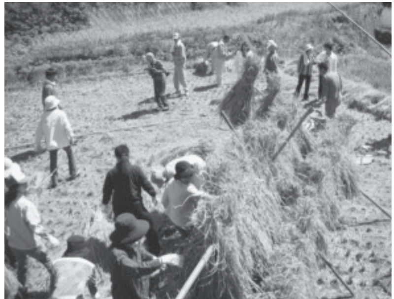
▲小城市グリーンツーリズム推進事業