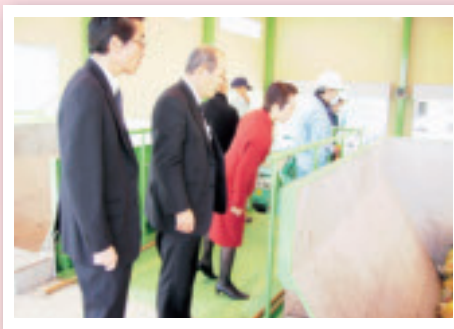
一般廃棄物中継センター 視察(3月24日)