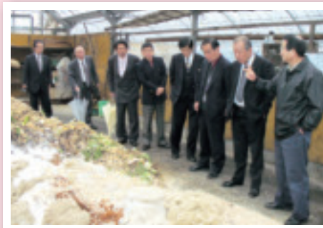
はちがめプラン 視察(3月23日)