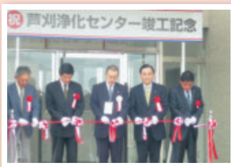
芦刈浄化センター 落成式(4月19日)