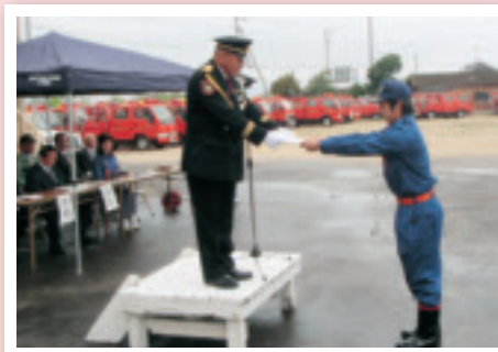
小城市消防団 辞令交付式(4月11日)