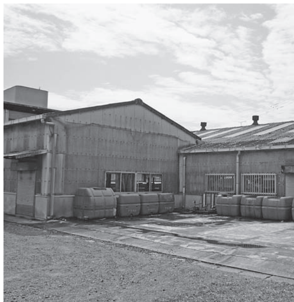
▲老朽化したカキ殻系状体培養場（芦刈町住ノ江）