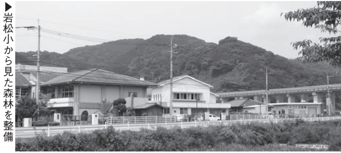
岩松小から見た森林を整備

水源のかん養や土砂の流出防止など森林の有する公益的機能の発揮が期待される重要な森林のうち、荒廃した森林または恐れのある森林について、市による公有化及び公的管理を進める。