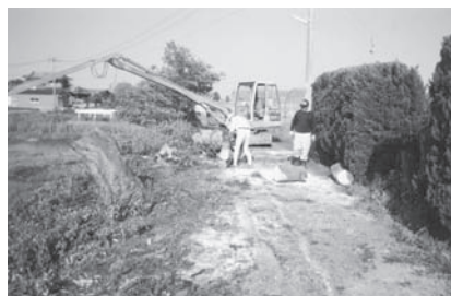
▲集落内の環境整備状況