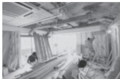
▲住居のリフォーム現場

部または一部修繕など、リフォーム工事を対象とする。工事に要する費用が50万円（税込）以上で、県内業者と請負契約を締結するものであることを条件とする。基本助成として、工事に係る費用に15%を乗じた額（最高20万円）。また、市内業者と工事請負契約を締結する場合は、工事に係る費用に10%（最高10万円）を上乗せする。