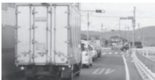
▲道幅が狭い大寺交差点東

（1,851万円） 三日月体育館へ進入する大寺交差点東の県道川上牛津線の道路拡幅に伴い、残地を買収し三日月体育館駐車場として活用します。また、この箇所は道路幅が狭く、歩道もなく危険であったことから市民の要望も高く、駐車場確保と併せて交通安全確保も図られます。