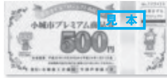
▲小城市プレミアム商品券(見本)

東日本大震災後の自粛ムードを払拭し、市内及び県内の地域商店等での消費を拡大することで、地域経済の活性化を図るために県と一体となって義援金付きプレミアム商品券の発行を行う。