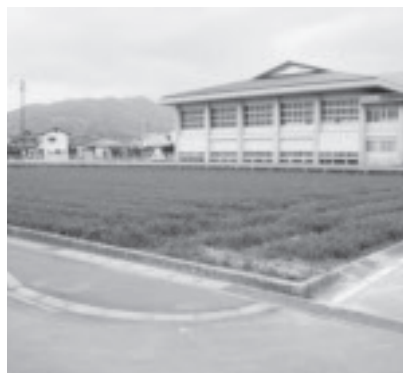
▲体育センターに隣接する農地

体育館の規模及び利用状況からして、大会開催時には駐車場が不足、農地を購入し約80台分の駐車スペースを整備する。