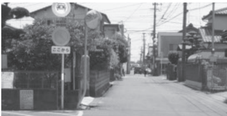
▲市道 小城公園・本告線