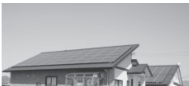
▲太陽光パネル普及促進は時代の流れ