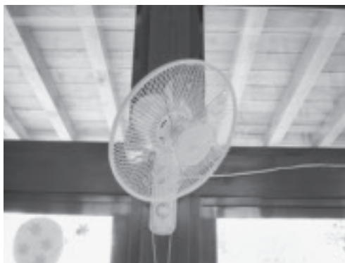
▲砥川保育園に設置されている扇風機

近年、地球温暖化現象により教室内の温度が高くなってきたため、市内小学校及び中学校の普通教室・特別支援学級に扇風機を設置し児童及び生徒の学習環境の充実を図る。