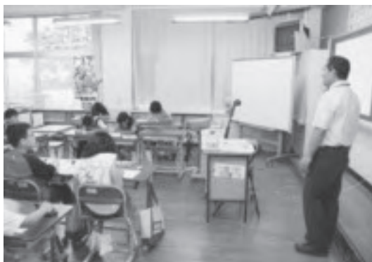
▲電子黒板を使った授業（砥川小学校にて）

国の教育情報化ビジョンに基づき、市内小中学校の教育情報化を推進、授業改善、学力向上を目指す。