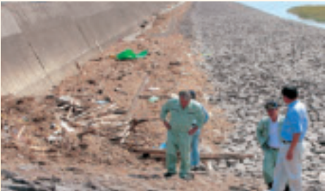
吹き寄せられたごみの山：芦刈海岸 （産業経済委員会）