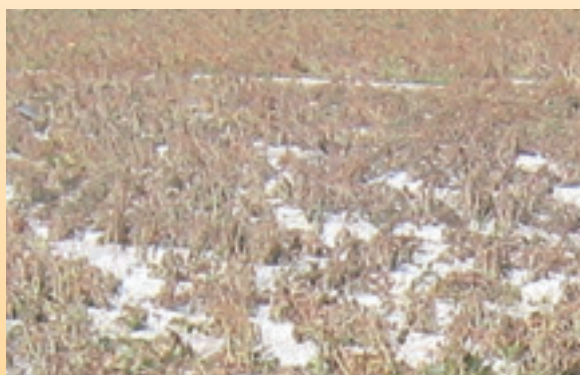
塩害により痛手を受けた大豆畑