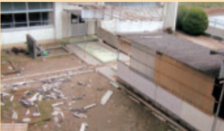
スレート屋根がバラバラ：芦刈小（文教厚生委員会）