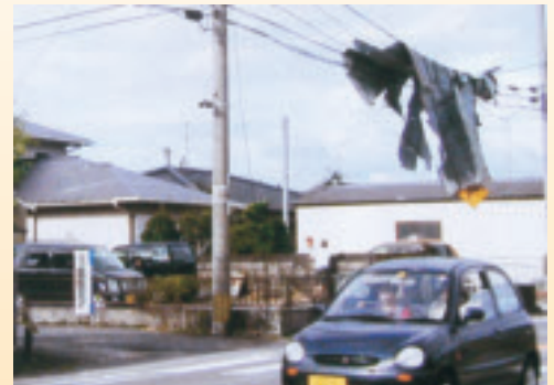
電線に引っかかったトタン屋根