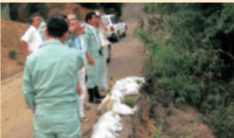
災害確認：小城町（建設委員会）