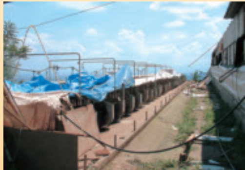
屋根が飛ばされた豚舎