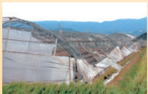
台風によるハウスの倒壊