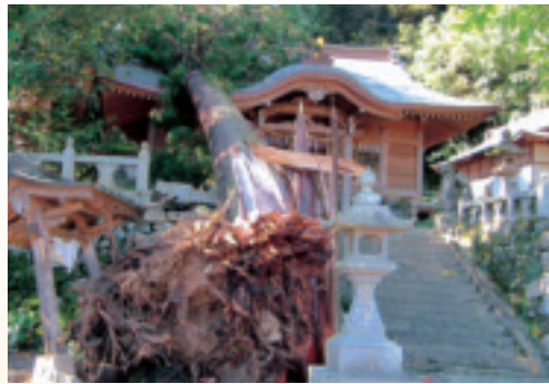
台風による倒木（晴気天山社）