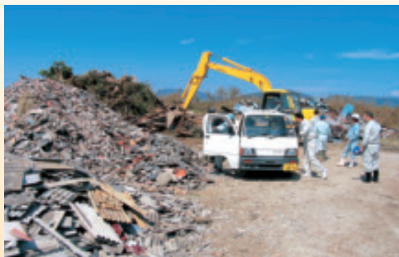
家屋などの被害から出たガレキの山