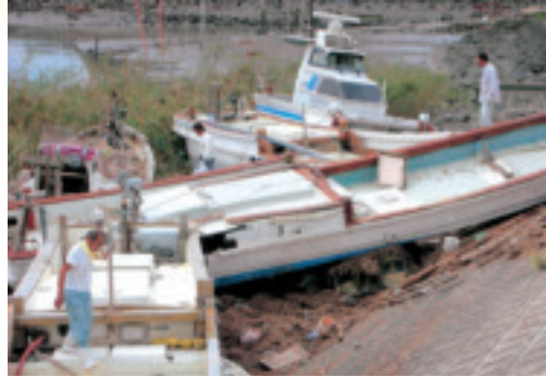
高潮で岸に乗り上げた漁船