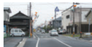
県道小城駅・千葉公園線 （小城本町）

☆街路小城駅・千葉公園線の道路改良事業に伴う 県営事業負担金として・・・4,785万円