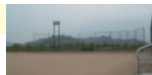
牛津総合公園 多目的グラウンド

☆街路小城駅・千葉公園線の道路改良事業に伴う 県営事業負担金として・・・4,785万円