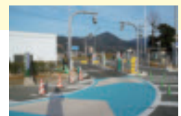
スマートインターチェンジ (イメージ図)

福岡市・長崎市などへの広域的アクセスの向上と交流人口の拡大を図るため、小城町内にある高速道路のパーキングエリアを活用し、ETC専用の出入口(スマートインターチェンジ)の新設に取り組みます。今年度は、高速道路への連結申請を行い、国からの許可を受けたあとで、詳細設計・測量、用地測量等の事業を進めていきます。 ※平成24年4月17日にスマートインターチェンジの事業については国から許可が下りました。