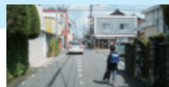
市道小城公園・本告線（小城本町）