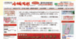
ショッピングモール小城万彩

地域経済の活性化および観光の振興・PRを図るため、インターネット上で小城市の特産品などを紹介し、その商品の買い物ができる「バーチャルショッピングモール(仮想商店街)」を通じて観光PR・特産品の販売促進に取り組みます。