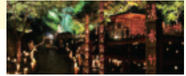
清水の滝と紅葉ライトアップ

小京都「小城」の代表的な観光地である「清水の滝」および周辺の紅葉をライトアップでPRし、埋もれている観光資源を再発掘することにより、秋から冬の観光客の減少を止め、年間を通して観光客の増加につなげます。