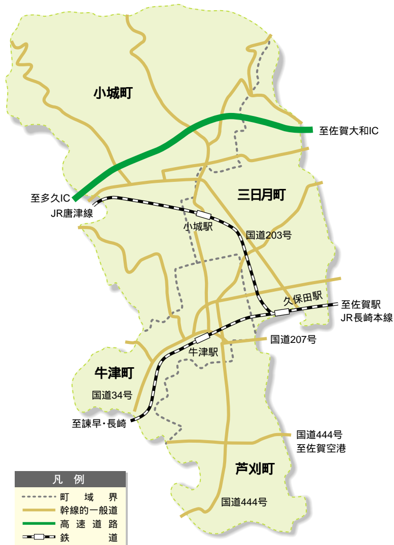
図 小城郡4町の交通条件

鉄道駅として、JR唐津線の小城駅、JR長崎本線の牛津駅、久保田駅の3駅があるなど、交通の要衝となっています。