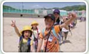
◎たてわり班活動(遠足)