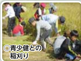
◎青少健との 稲刈り