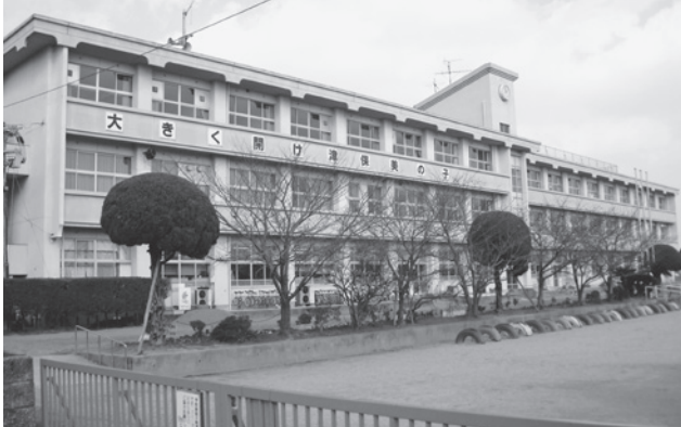
▲今年度より大規模改造予定の牛津小学校

イレ改修、エレベーター設置等を予定していたが、老朽化のため電気設備及び機械設備についても改修が必要。さらに、児童の安全確保のため仮設校舎