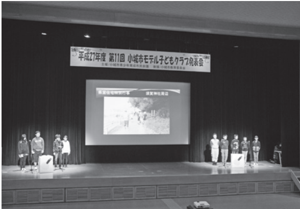
▲モデル子どもクラブ発表会風景