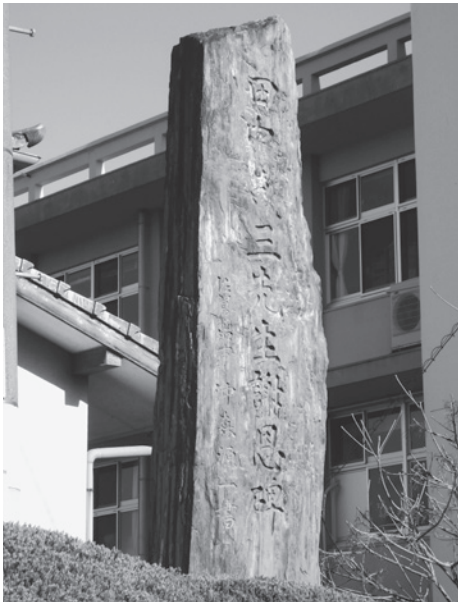
▲牛津高校の片隅にたたずむ謝恩碑

現在牛津高校の門のところに東側に碑があり、なかなか見えにくい状況だ。案内・説明板については慎重に対応し決定すべきものと思う。