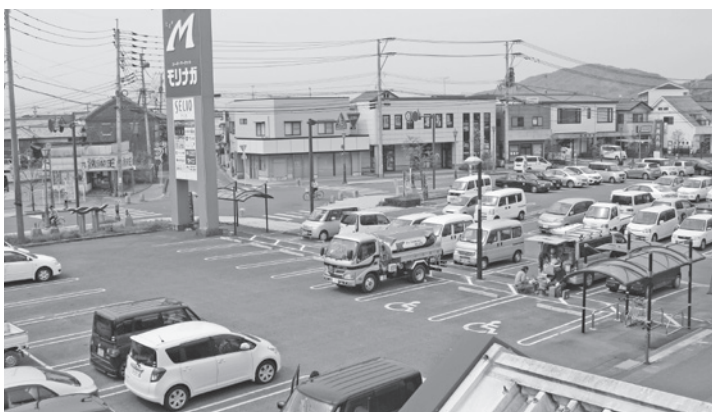
▲活性化が待たれる牛津商店街