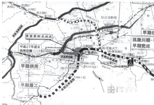
▲佐賀県南部主要道路

チャンス逃さず、余裕は2年しかない、作る方向での道筋を立て、検討をお願いできるか。