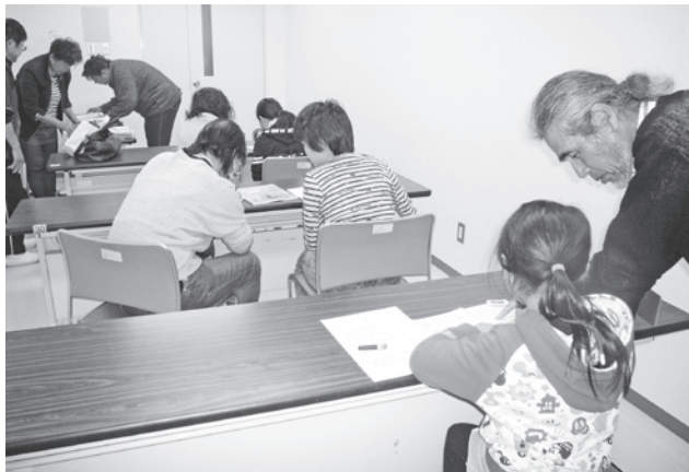
▲市内で始まったひとり親家庭への教育支援(牛津公民館)

字はないが、ひとり親家庭の生活の安定と自立の促進のための児童扶養手当の対象児童数（18歳までは、平成25年度446世帯697人、26年度435世帯655人、27年度449世帯681人。国の統計では、ひとり親世帯の貧困率が54・6%であることから、市内も手当対象の半数が貧困世帯ではないかと推測される。