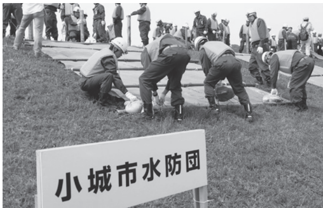
▲昨年5月の牛津川での総合水防演習のもよう

今年2月末で、出前 講座8回、消防署・ 消防団との共同消防 訓練3回、土砂災害 警戒指定説明会15 回、避難訓練2回、 子ども向け講座2 回、住民のタイムラ イン作成2回、防災マッ プ作りの地区防災連絡会 2回、市内全区長の研修 会1回で延べ38回、地区 等に出向いて支援を行い 延べ1,022人が参加。 自主防災組織リーダー研