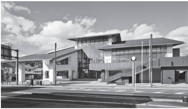
▲交流人口の増加につなげ「ゆめぷらっと小城」

交流プラザについては、駐車場を課題点として質問をするつもりだったが、新聞報道で、「開館後禁