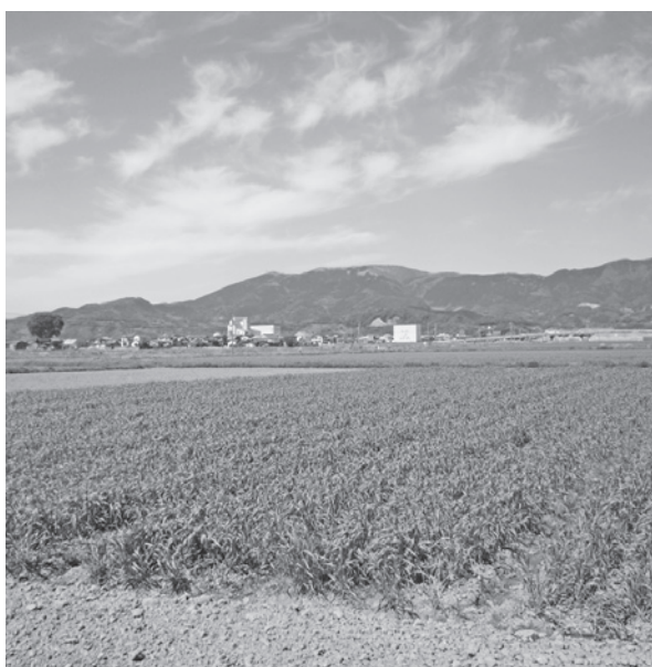
▲麦作は続けられるだろうか

副市長 議会にも相談しながら、28年度中の策定を目指すことになり、まずは採択されるよ