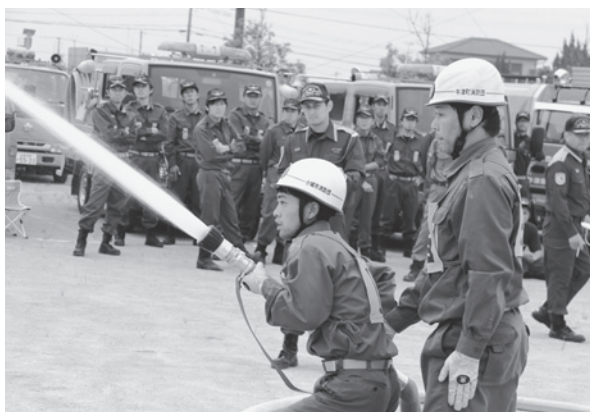
▲消防団による小型ポンプ操法