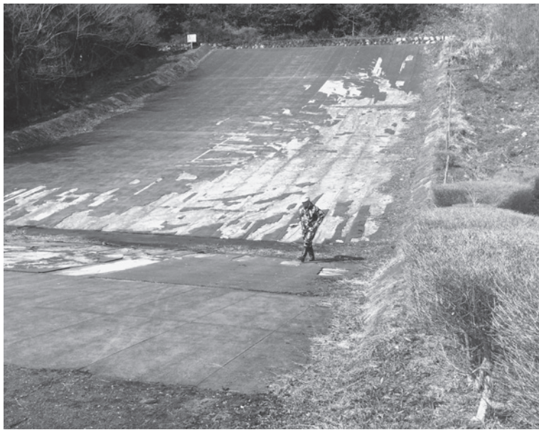
▲芝生が剥げた人工草スキー場