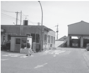
▲センター稼働後の跡地利用の検討が望まれる中継センター

定を結ぶことはいいことだが、1炉と2炉の維持管理費用を含めた比較検討の結果を見極めることが必要。