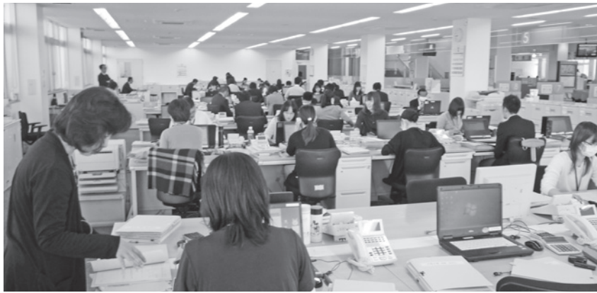
▲期待される人事評価制度