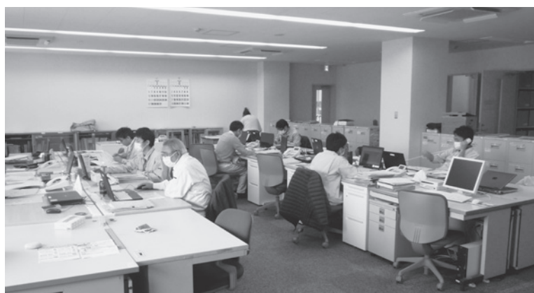
▲庁舎内での行政事務の状況