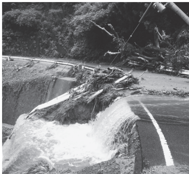
▲林道天山線(焼山～江里山間)ガードレール・法面崩落

6月19日～25日の梅雨前線豪雨により被災した道路を原形に復旧し、道路の安全性確保を図る。