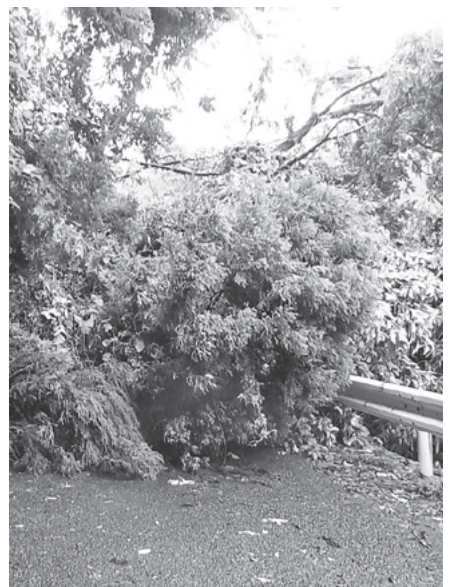
▲市道 川原・桑鶴線

6月22日からの梅雨前線豪雨により被災した林道天山線、川内線、3か所の林道の路肩、舗装及び林道敷に堆積した土砂を撤去し、原形復旧する。