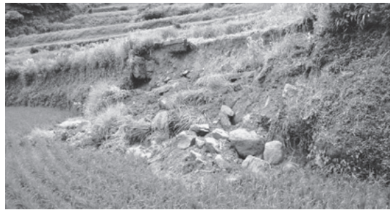
▲江里山農地 畦畔法面崩落

雨及び、6月22日からの梅雨前線豪雨によって被災した農地(田・畑)、農業用施設(農道・水路)を原形復旧し、農地・農業用施設の回復を図る。