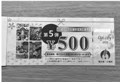
▲前回（第5弾）の復興応援券

コロナ禍における原油価格や物価の高騰等の影響を受けている市民及び事業者の負担を軽減するため「小売店舗等復興応援券」を発行し、市民生活の支援及び商業の復興を後押しするため、復興応援券送付等の準備。