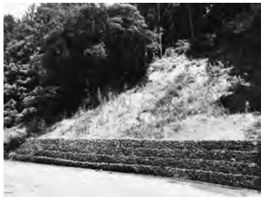
▲土砂災害復旧後の石積み

自然災害によって被災した林業施設を復旧することで林業施設の維持を図り、林業経営の安定に寄与するため、令和5年7月豪雨で被災した林業施設の原形復旧工事。