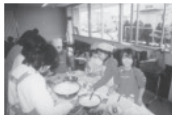
クリスマスケーキ作り(芦刈公民館)