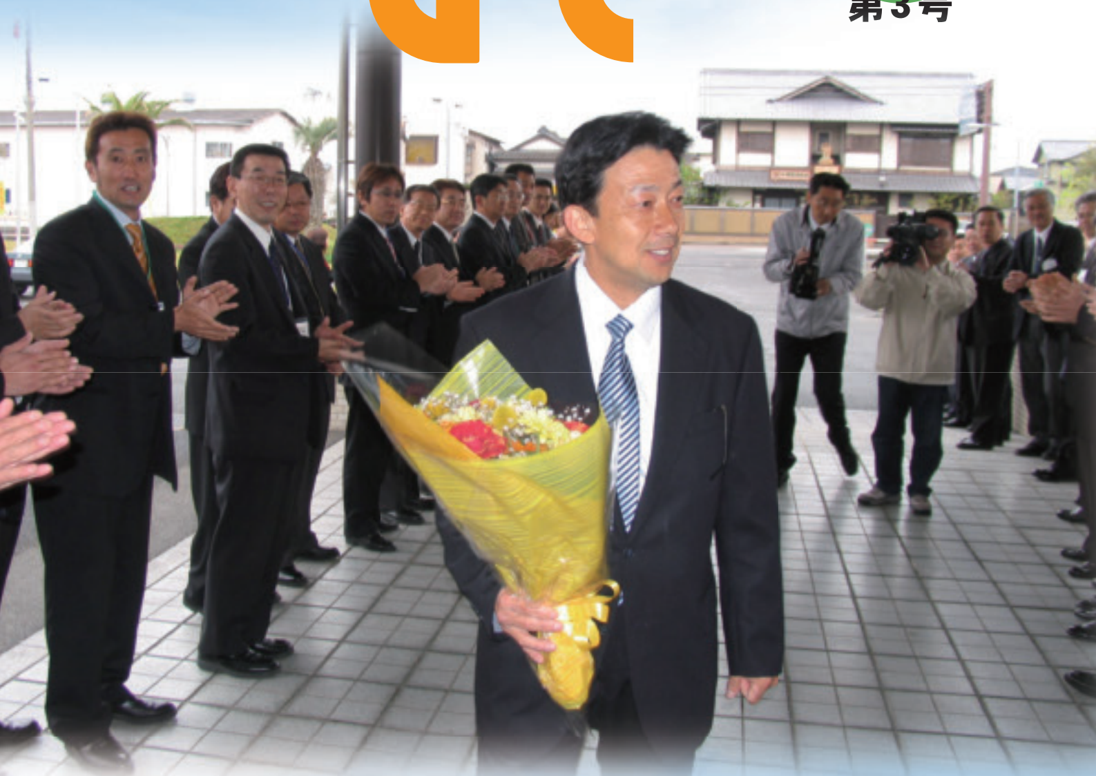
江里口市長初登庁