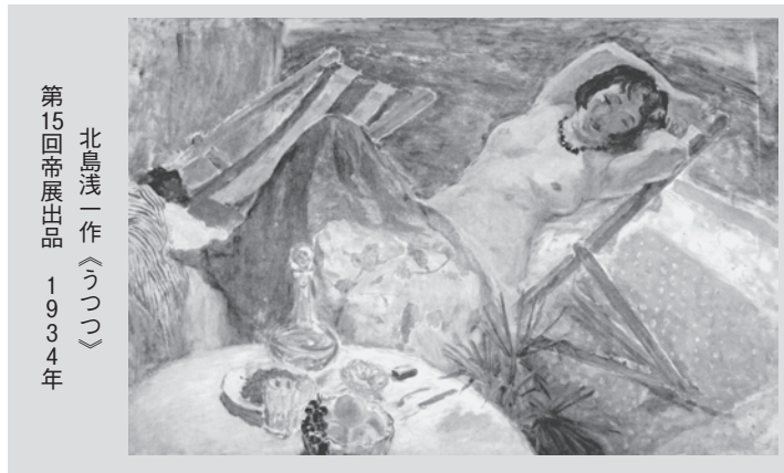
北島浅一 作《うつつ》 第15回帝展出品 1934年

7月8日(日)まで 午前9時~午後5時 ※月曜休館 ◆ところ 市立歴史資料館企画展示室