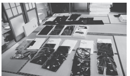
太鼓浮立衣装羽織着物一式