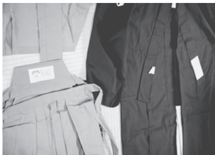
太鼓浮立衣装袴(かみしも)一式