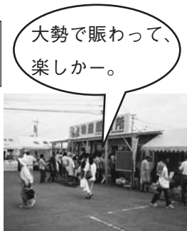
大勢で賑わって、楽しかー。