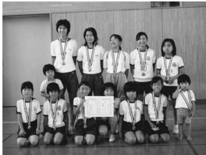
甘木子どもクラブ

8月5日、12日に市内各所で小城市子どもクラブ球技大会が、スポーツでの交流を通して友愛、助け合う人間性を養う目的に行われました。