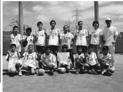
三ヶ島子どもクラブ