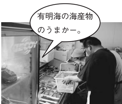
有明海のおまかせ