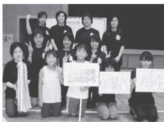
小城市役所 北の町から