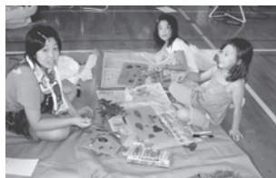
アート(自然の素材で絵画)