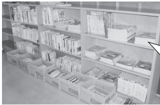
前回(2008.7)のブックリサイクルのようす