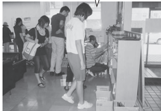
多くの方のご来場をおまちしています!