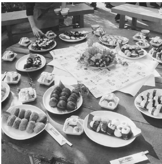
↑種類も豊富、食材の多さにびっくり