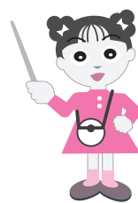
だまされない! ともちちゃん