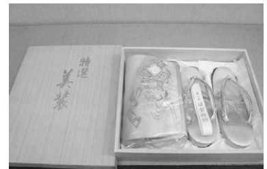
▲草履バッグセット