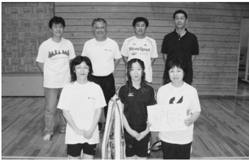
1部優勝久米Bチーム