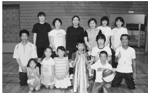
2部優勝三ヶ島チーム