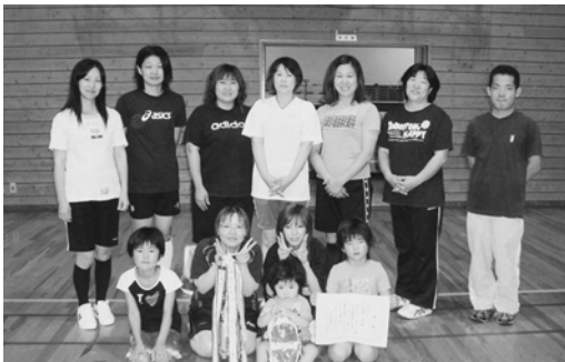
3部優勝深町チーム