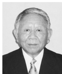
担当地区 小城町萩ノ町・黒原