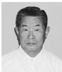
担当地区 芦刈町三条・高道