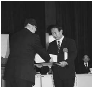
賞状と記念品を受け取られる受賞者。

平成21年度市政功労者表彰式を、昨年(2009年)の12月19日(土)に開催しました。これは、多年にわたり市政の発展に大きく貢献された方々の功績をたたえるもので、今年度は19名の方が受賞されました。