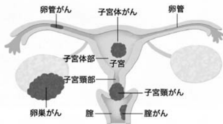
図：子宮の構造と女性性器がんの種類