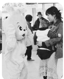
うさぎがお出迎え