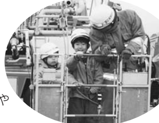
はしご車 乗車体験