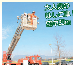
大人気のはしご車！ 空中25m