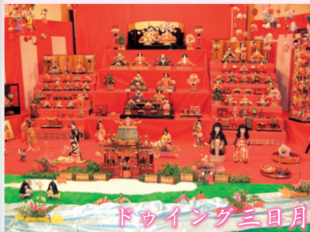
ドゥイング三日月

今年からは、点から線につながるイベントとして、小城市文化連盟などを中心に、小城市内の四会場で開催しました。