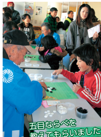
五目ならべを教えてもらいました