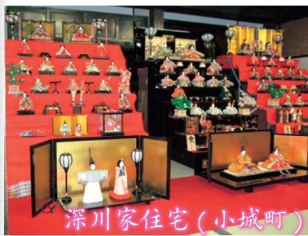
深川家住宅(小城町)

各会場とも趣を活かした飾り付けや、お琴の演奏会、お茶席、折り紙を使ったひな人形作りの体験講座など、ひなまつりを楽しむ家族連れで賑わいました。当日はスタンプラリーもあり、四会場を回った方には賞品が贈られました。