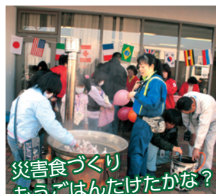
災害食づくりもうごはんだけたかな？