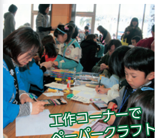
工作コーナーでペーパークラフト