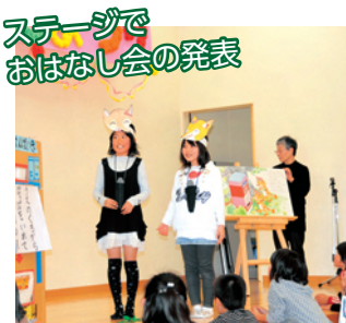
ステージでおはなし会の発表