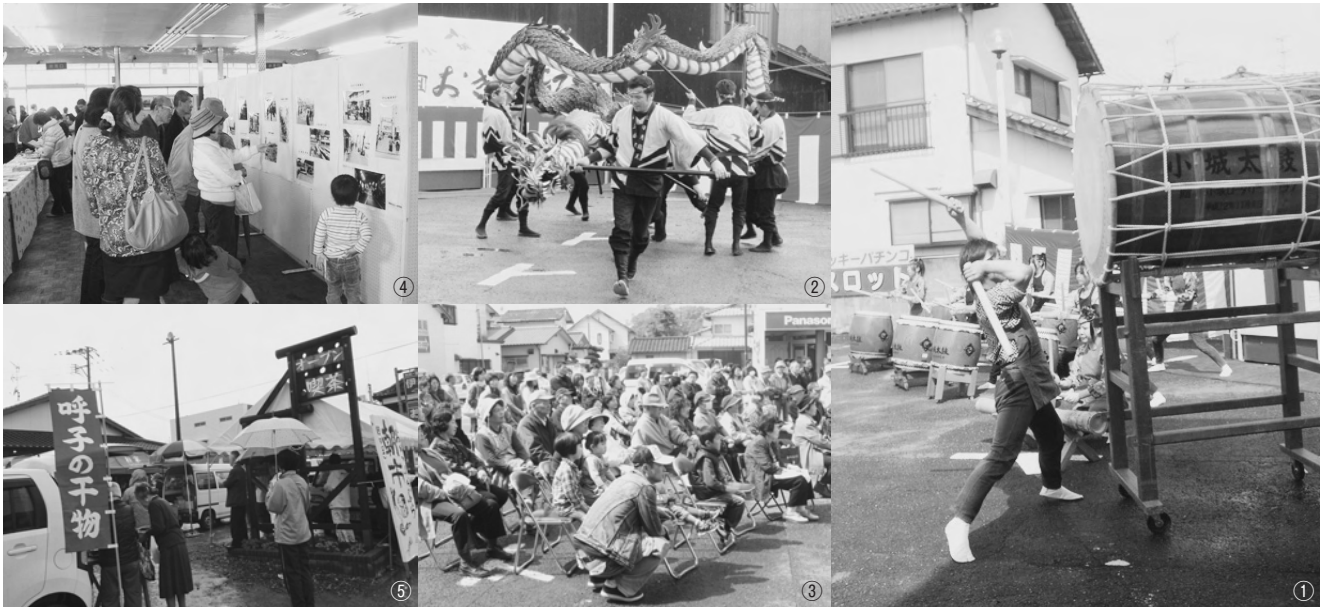
①小城太鼓の力強い音が小城市の空に響き渡りました。②躍動感のある三日月龍王浮立。③パフォーマンスに観客から盛大な拍手。④昭和のまちなか写真展では多くの人が昔を懐かしんでいました。⑤小城・呼子・竹崎・南九州からのうまかもんに行列が！

3月13日（土）・14日（日）、小城市町通り界隈で開催された第1回おぎぶらぶらフェスタは多くの参加者で賑わいました。 新鮮な農産物に、迫力あるパフォーマンスと、大盛況で終えることができました。 これからも、市民が中心となって、4町の個性を活かし、小城市全体を発展させていきたいと思います！ ご協力をいただいた皆さん、本当にありがとうございます。