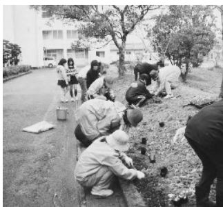
中学校の玄関前に植栽

その後、幼稚園、小学校、中学校の花壇などにも植栽し、公共施設は、色彩豊かな花で彩られました。婦人会のメンバーは、卒業、入学の時に子ども達へ良好な環境を提供したいということで、毎年3月に植栽をされています。