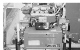
ポンプ参考 (B-1 写真)