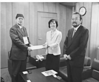
（中央）澤野会長、（右）副島副会長から（左）市長に手渡されました。

あーも！計画については、3月20日号市報に概要を掲載しています。今後、ダイジェスト版を各家庭に配布予定です。