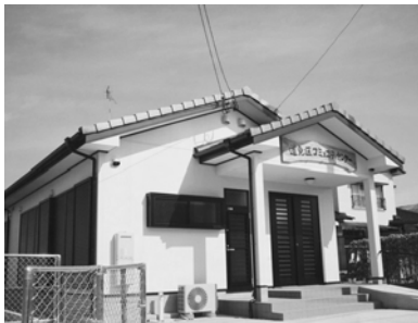
平成21年度宝くじ助成活用事例 道免区コミュニティセンター(芦刈町)(新築)

平成21年度はこの宝くじの「コミュニティセンター助成事業」を受け、「芦刈町道免区コミュニティセンター」が建設されました。