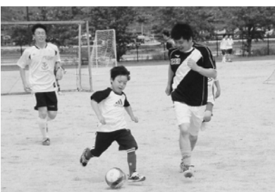
子どもと大人の交流試合。子ども達は、がんばりました！