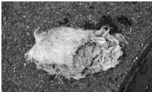
管に詰まっていたナイロンたわし