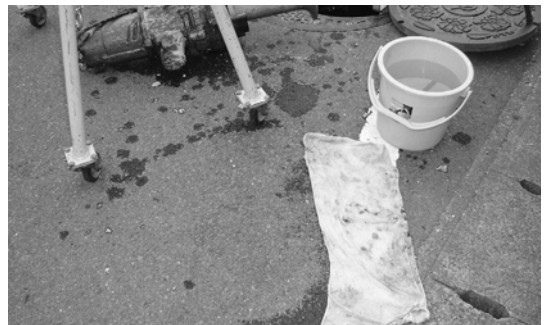
管に詰まっていたタオル

◆トイレでは、溶ける紙(トイレットペーパー)を利用してください。生理用品・タオル・パンツ・靴下・ビニール・タバコ・ガムなどを流さないでください。