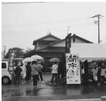
小城マルシェ(3/13開催)の一場面。