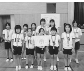
北小路(小城市)チーム