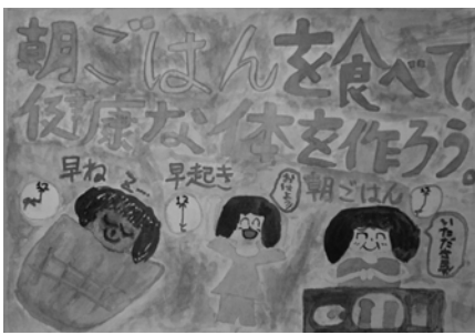
松永 佳奈 晴田小 4年