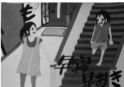
西村 有加 三日月中 3年