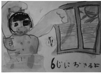
諸隈 瑞季 岩松小 1年