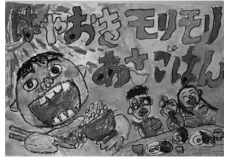
圓城寺 洸英 桜岡小 1年