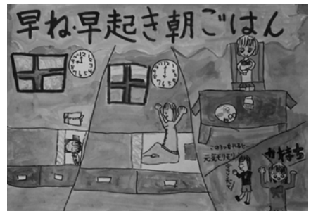
南里 杏佳 芦刈小 5年