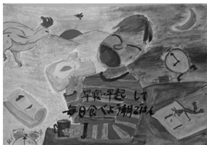
中島 由勝 三日月中 3年