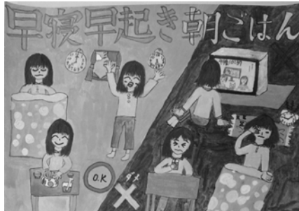
持永 美南 桜岡小 4年