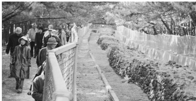
元寇防塁跡は一部復元されています。

小城市立歴史資料館 小城市立歴史資料館 文化課(桜城館2階) ☎71-11132