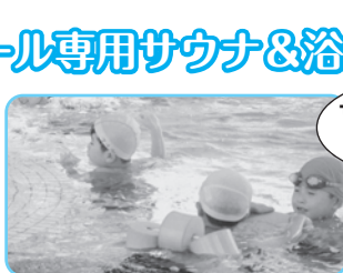
一年中泳げるプールは温泉水が たっぷり入った贅沢なプールです