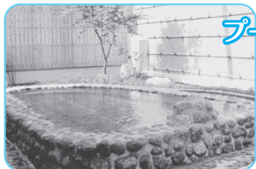
泉質が自慢のかけ流し天然温泉 (泉質…ナトリウム炭酸水素塩泉)