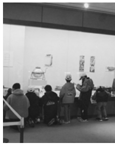
さおばかりで重さを量る体験をしました。

12月17日（金）～2月3日（木）にかけて「むかしの道具に見るくらしのうつりかわり展」を開催しました。会期中は市内の小学3年生が社会科の授業の一環で見学に訪れました。