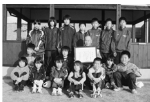
（右）芦刈むつごろう走友会 （左）晴田少年野球クラブ