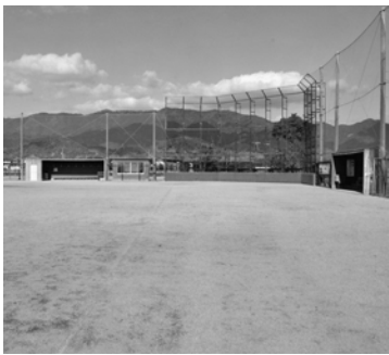
三日月グラウンド