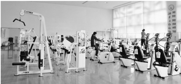
明るく開放的なトレーニング室