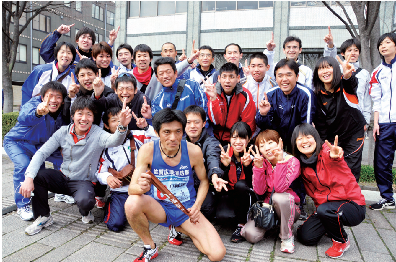
3日間にかけて激闘を勝ち抜いた小城市チームの皆さん。ゴール後の集合写真。