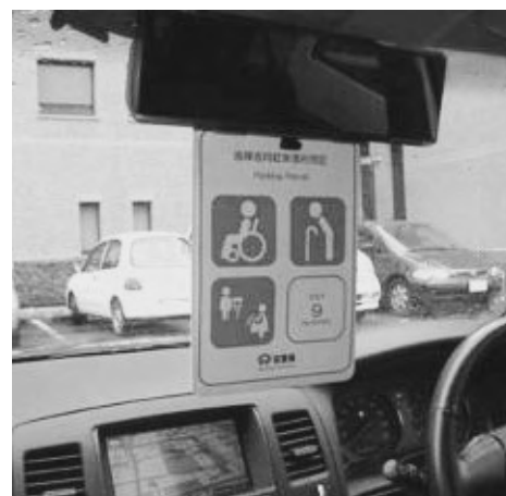
利用証は外からも見えやすいように、ルームミラーに掲げます