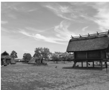
▲土生遺跡公園(三日月町)