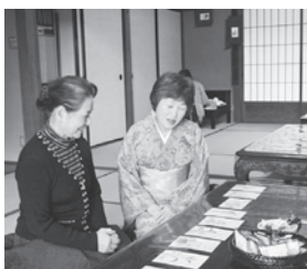
▲無有庵・一誠荘 松風会花展 絵葉書の展示

また、同時開催のスタンプラ リーでもたくさんのお応募がありま した。参加者からは、「小城の街 に触れ合うことができて楽しかつ た」「普段見られないものを見る ことができ、勉強になった」と いった声が聞かれました。