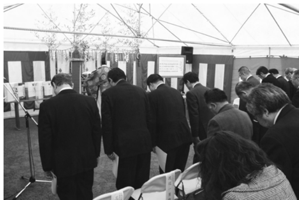
▲昨年の11月29日(火)、安全祈願祭を行いました。

新庁舎建設地周辺整備のお知らせ 新庁舎建設に併せて、三日月庁舎周辺の市道整備や下水道整備を行います。工事期間中は、ご迷惑をおかけしますがご理解とご協力をよろしく願います。