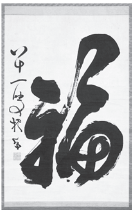
「福・八十一 叟梧竹」